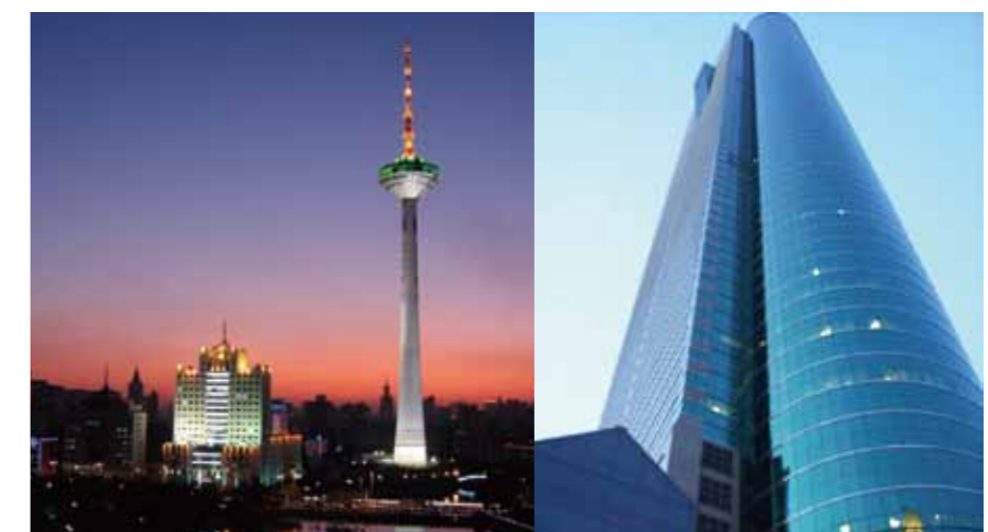
东芝新分公司落户沈阳、深圳

各个投资因素均位居前列。东芝将利用自身的创新能力和坚实的服务体系为客户以及合作伙伴提供先进的技术和方案,同时也为东北及珠三角地区打造特色区域经济注入创新动力。