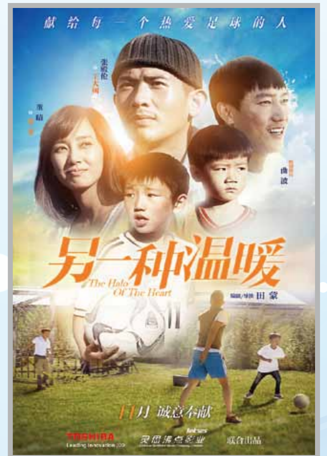
《另一种温暖》电影海报

此次借助《另一种温暖》,东芝将“助力青少年健康成长,支持孩子们的足球梦想”主题以微电影的形式广泛传播,让更多的人关注中国足球,关注青少年足球,也让更多的爱与温暖助推中国足球的健康发展。(TCH 苗洪侠)