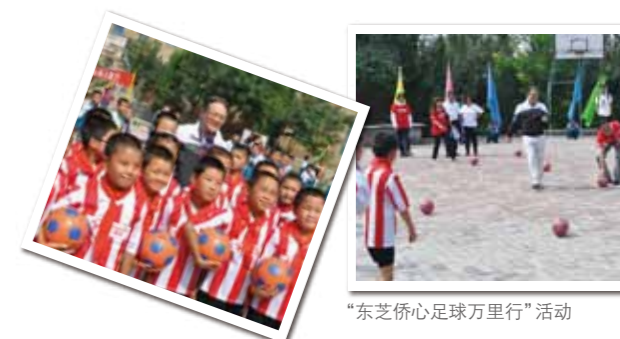
“东芝侨心足球万里行”活动