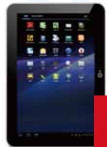
东芝铂金 AT200平板电脑

时尚华丽的工业设计,强悍的硬件规格,以及丰富的功能接口,都是东芝铂金AT200平板电脑值得称道的地方,也是令它获得今年iF产品设计大奖的重要因素。(TPCS 范艳)