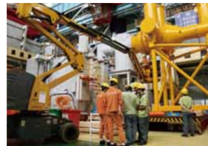
SF 6 气体绝缘变压器

9月16日,由中电装备东芝(常州)变压器有限公司(以下简称CTC)为南京市重点工程——南京鼓楼变电站自主研发的80MVA(兆伏安)/110kV(千伏)的SF 6 气体绝缘变压器一次性通过出厂试验,各项技术性能指标均达到、部分指标优于国家标准和技术协议要求,处于国内领先地位。